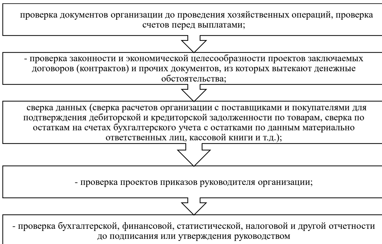
Рисунок 1 - Мероприятия предварительного контроля товарных операций

Предварительный контроль осуществляется до начала совершения фактов хозяйственной жизни, он позволяет определить, насколько целесообразной и правомерной будет та или иная операция. Мероприятия, проводимые при предварительном контроле представлены на рисунке 1 [3-5].