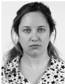
М. А. Булгакова,