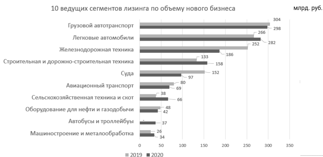
Рис. 3. Ведущие сегменты лизинга по объему нового бизнеса

Согласно данным рейтингового агентства «Эксперт РА» можно выделить 10 ведущих сегментов в сфере лизинга [2]. На рисунке 3 наглядно представлены изменения в данных сегментах за 2019–2020 годы.