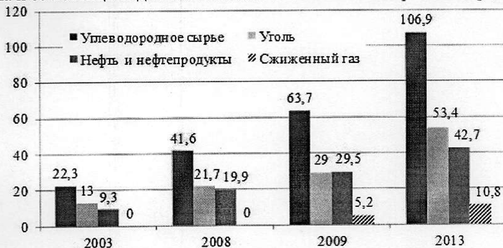
Рис. 1. Динамика экспорта углеводородного сырья России в АТР через морские порты Дальнего Востока, млн. тонн

Одновременно возрос спрос на углеводороды и электроэнергию в странах АТР, прежде всего в Японии, КНР и Республике Корея. Стоит отметить, что в 2013 г. экспорт российского каменного угля через морские порты Дальнего Востока составил 53,4 млн. тонн, сырой нефти и нефтепродуктов 42,7 млн. тонн, сжиженного газа 10,8 млн. тонн, что почти в 5 раз больше показателей 2003 г. (рис. 1). В том же 2013 г. по существующей линии электропередач из Амурской области в КНР и Монголию было экспортировано 3,9 млрд. кВт час электроэнергии. Так же велико значение транспортной системы региона и её потенциал для обеспечения экономического развития [4, с. 55-58].