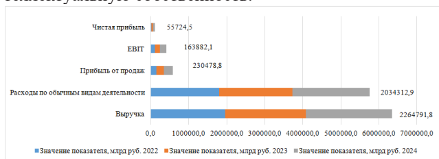
Рисунок 3 – Прогноз доходов компании на 2023 и 2024 год с помощью темпа роста

Эффективность управления компанией ОАО «РЖД» будет учтена при дальнейшем расчете стоимости гудвилла компании на плановые периоды 2023 и 2024 годов. Далее представим прогноз доходов компании на 2023 и 2024 год с помощью темпа роста (рисунок 3). Значение нематериальных активов компании увеличилось на 10 460 612 млн руб., что составляет прирост на 61 % [6]. Данное увеличение связано с инвестициями компании в исследования и разработки, приобретение прав на интеллектуальную собственность.