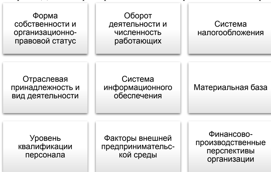
Рисунок 3 - Факторы формирования учетной политики экономического субъекта

факторов. Данные факторы схематично представлены на рисунке 3.