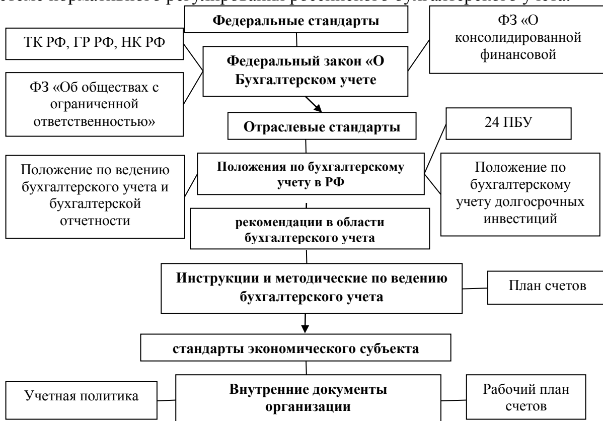
Рисунок 1 – Уровни нормативно-правового регулирования бухгалтерского учета в России

Согласно рисунку 1 учетная политика занимает особое положение в системе нормативного регулирования российского бухгалтерского учета.