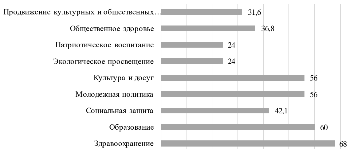
Рисунок 1 - Мнение экспертов о сферах применения проектов социального воздействия, %

Наименьшее количество ответов получили сферы экологического и патриотического образования (воспитания) – 24,0%. На вопрос, «Какой результат следует ожидать от проектов социального воздействия?» на первое место эксперты поставили рост доступности гарантированных государством социальных услуг и снижение заболеваемости населения – по 73,7% ответов, и рост занятости населения – 63,2% ответов респондентов (рисунок 2).