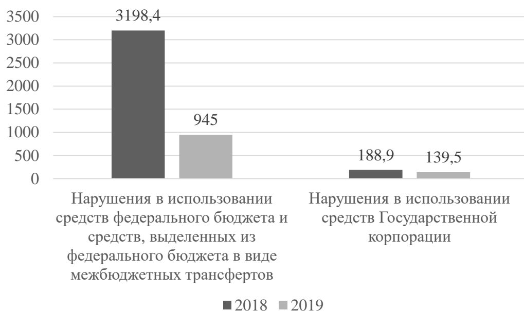
Рисунок 1.2 – Структура и динамика выявленных нарушений контрольно-ревизионным отделом Федерального казначейства РФ за 2018-2019 гг., млн.руб.

Снижение суммы выявленных нарушений также говорит об эффективной работе сотрудников контрольно-ревизионного отдела в сфере развития экономики. В таблице 1.3 представлены структура и динамика, предъявленных мер воздействия за рассматриваемый период.