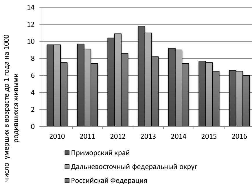
Рис.2. Динамика коэффициента младенческой смертности

Для понимания ситуации недостаточно посмотреть лишь на общий коэффициент рождаемости. Необходимо учесть показатель младенческой смертности, который, как в нашем регионе, так и в целом в России, довольно значителен. На графике (рис.2) [2] наглядно видно, что младенческая смертность в Приморском крае находится примерно на одном уровне со смертностью по ДФО в целом, местами немного ее опережая. В 2013 году показатель в Приморском крае достиг значения 11.8, а затем приобрел активную тенденцию к уменьшению.