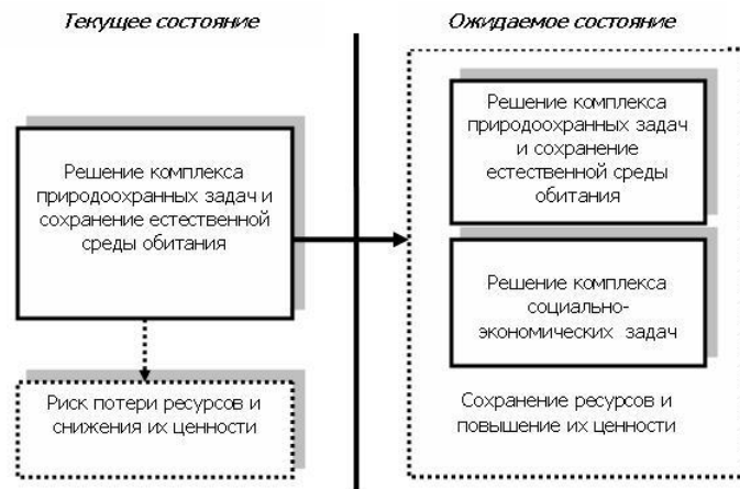
Рисунок 3 - Управление переходом к устойчивому развитию особо охраняемых природных территорий как ресурсосберегающей системой

Основной предпосылкой такого перехода, по мнению автора, являются выстраивание полного цикла трансляции ресурсов особо охраняемых природных территорий в товары и услуги, что выражается в создании новых товаров, услуг, процессов, удовлетворении потенциального спроса и роста общественного воспроизводства, как одного из факторов устойчивого развития.