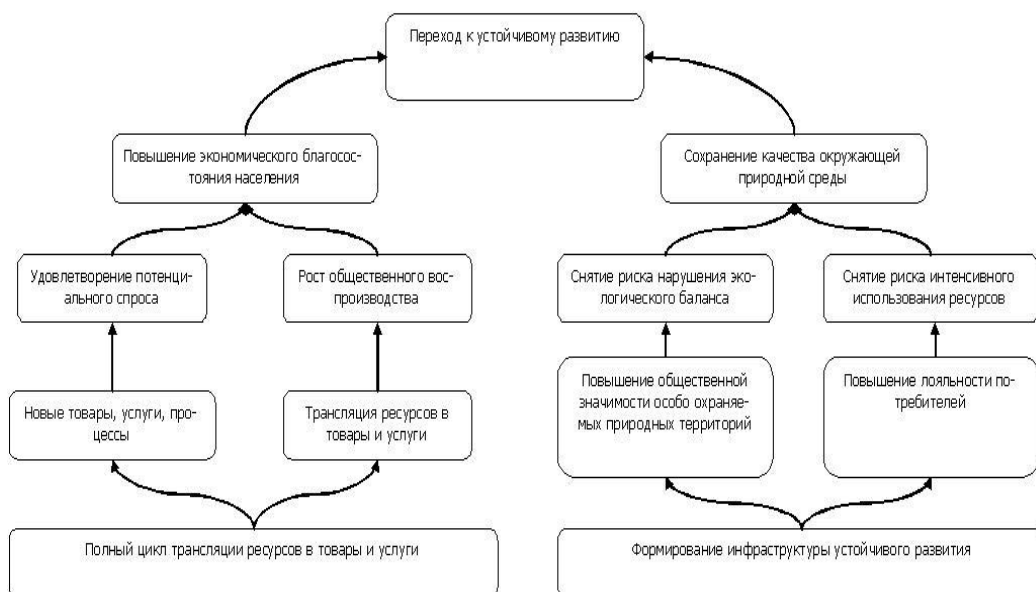
Рисунок 4 Стратегическая карта перехода особо охраняемых природных территорий к устойчивому развитию

В целом, совокупность указанных предпосылок является основой перехода к устойчивому развитию, что позволило разработать стратегическую карту обеспечения такого перехода.