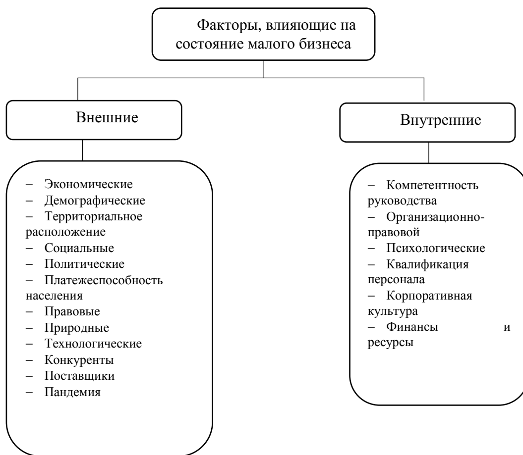
Рис. 1. Факторы, влияющие на состояние малого бизнеса

Факторы, влияющие на развитие и эффективное функционирование малого бизнеса, можно классифицировать как внутренние и внешние (рис.1).