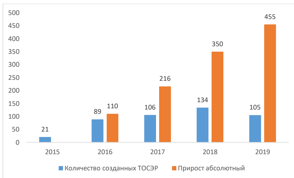
Рисунок 1 – Динамика количества резидентов

За прошедшие годы после принятия соответствующего Федерального закона количество ТОСЭР увеличилось более чем в 2 раза с 9 ТОСЭР в 2015 году до 21 ТОСЭР в 2020 году. Оценка экономической составляющей показывает, что объем привлечённых инвестиций увеличился в 39 раз с 187 млрд. руб. в 2015 году до 7463 млрд. руб. в 2018 году. Количество резидентов увеличилось в 20 раз с 21 в 2015 году до 455 в 2019 году. Оценка социальной составляющей, показывает, что количество созданных рабочих мест увеличилось в 9 раз с 7666 в 2015 году до 71272 в 2019 году (рис. 1, 2).