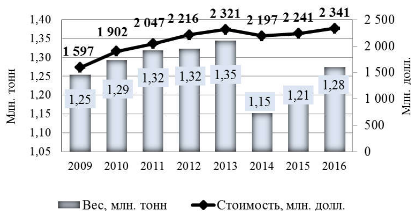
Рисунок 3 – Динамика весового и стоимостного объема экспорта рыбы и морских беспозвоночных в ДФО за 2009-2016 гг. [6]

За последние 8 лет (2009-2016 гг.) объем весового экспорта рыбо- и морепродуктов увеличился незначительно – на 1,7%, или на 20,8 тыс. тонн, достигнув максимума в 2013 г., отражая некоторую цикличность функционирования рыбодобывающей отрасли. При этом, экспортная выручка рыбодобывающих предприятий в последние годы устойчиво растет, что связано с сохранением высокого спроса на рыбо- и морепродукты со стороны стран-импортеров, а также увеличением в объеме экспорта доли особо ценной морской продукции – крабов, моллюсков и других беспозвоночных животных, употребляемых в пищу. За 2009-2016 гг. стоимость годового экспорта возросла на 745 млн. долл., или в 1,5 раза, а коэффициент опережения роста доходов от экспорта по сравнению с ростом весового объема равен 1,4 (рисунок 3).