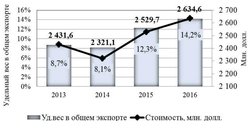
Рисунок 2 – Динамика объема и доли группы продовольственных товаров и сельскохозяйственного сырья в общем объеме экспорта ДФО за 2013-2016 гг. [3]

Особенность географического положения Дальневосточного федерального округа, его уникальные запасы морских ресурсов обуславливают специфику формирования производственно-отраслевой и экспортной структуры региона, в которой значительную часть занимает пищевая продукция и продовольственное сырье (рисунок 2).