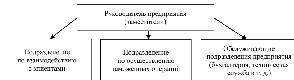
Рис. 2. Организационная структура юридического лица – таможенного представителя, оптимальная с точки зрения эффективности текущей работы

Улучшению качества услуг в сфере таможенного оформления также будет способствовать оптимизация внутренней организационной структуры самого таможенного представителя за счет грамотного разделения обязанностей между работниками. Предоставление услуг по таможенному оформлению подразумевает выполнение большого количества текущих работ: сбор необходимой коммерческой документации для оформления электронной декларации на товары, взаимодействие с клиентами, экспедиторами, транспортными компаниями, контейнерными терминалами по вопросам предоставления требуемых для таможенных органов документов, проведение досмотров, прохождение санитарно-карантинного контроля, карантинного фитосанитарного контроля в отношении товаров различных групп фиториска, проведение отборов проб и образцов для предоставления в сертификационные органы, а также сам процесс заполнения электронной декларации и ее подачи в таможенные органы, последующее взаимодействие с таможенными органами до выпуска декларации на товары. В связи с разнородностью выполняемых работ и необходимостью увеличения скорости и эффективности выполнения считаем оптимальной следующую структуру юридического лица – таможенного представителя (рис. 2).