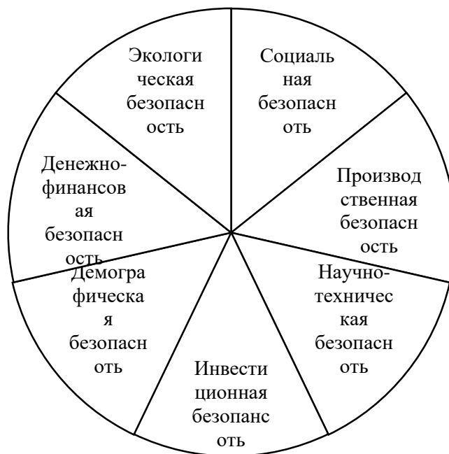
Рисунок 2 – Элементы экономической безопасности региона

На рисунке 2 представлены элементы экономической безопасности на региональном уровне