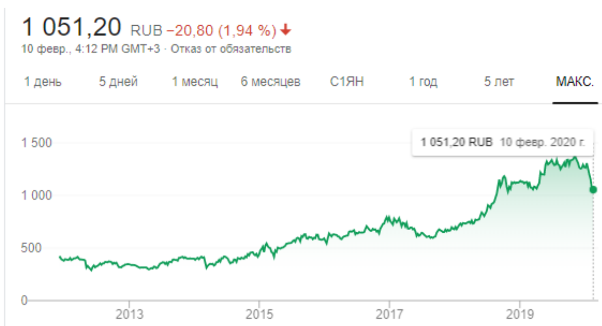
Рис. 2. График акций ПАО «Новатэк»

В ходе нашего исследования нельзя не рассмотреть график стоимости ценных бумаг эмитента. График отражает изменение стоимости курса акций. График стоимости акций ПАО «Новатэк» представлен на рис. 2.