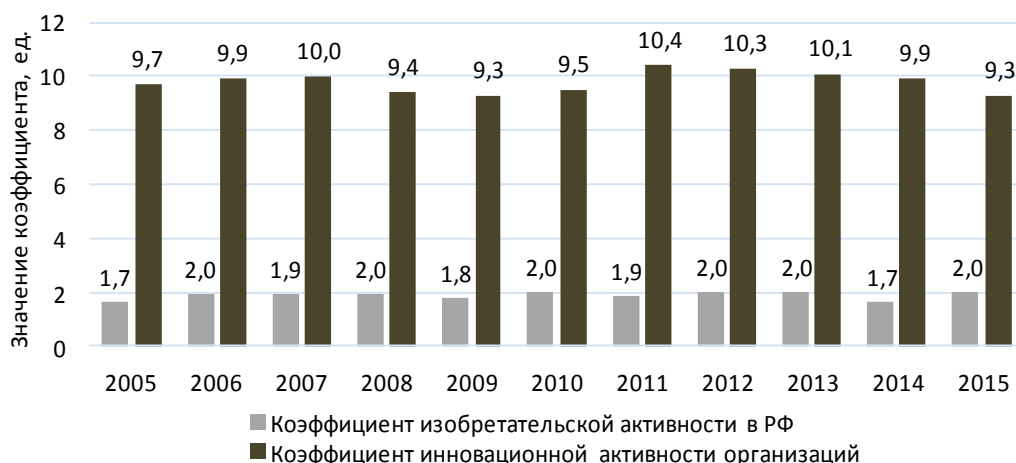
Рис. 3. Динамика коэффициентов изобретательской и инновационной активности в России за 2005–2015 гг. [5; 15]

исследованиями и разработками, в 3 раза меньше, чем в США [15; 16]. Особые индикаторы, отражающие уровень развития предпринимательских способностей и интеллектуального потенциала бизнеса – коэффициенты изобретательской и инновационной активности – демонстрируют отсутствие какой-либо значимой положительной тенденции в инновационной сфере (рис. 3).