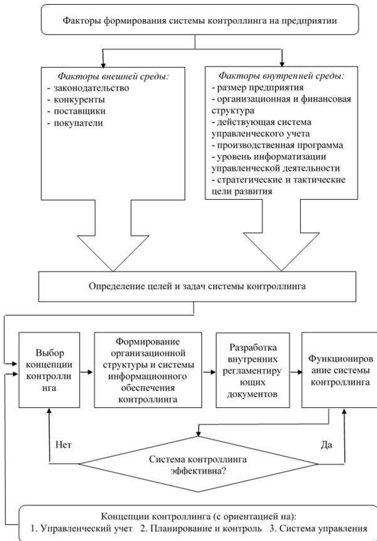
Рис. 2. Модель системы контроллинга на промышленном предприятии

Для построения эффективной системы контроллинга на промышленном предприятии необходимо исходить из следующих предпосылок: