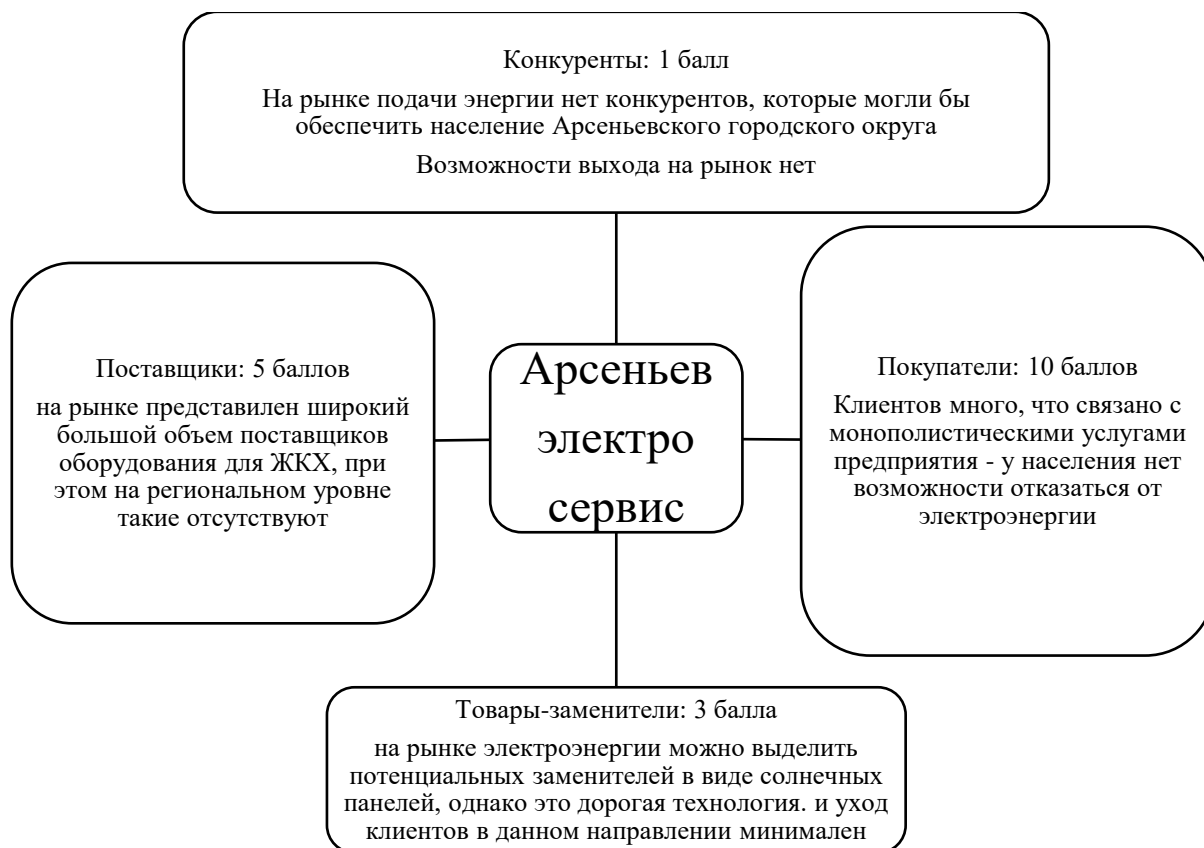
Рисунок 2 – Количественный результат оценки конкурентных сил рынка по модели М. Портера

Оценка степени конкуренции в первую очередь производится посредством построения модели М. Портера [4]. На рис. 2 представлена количественный результат оценки.