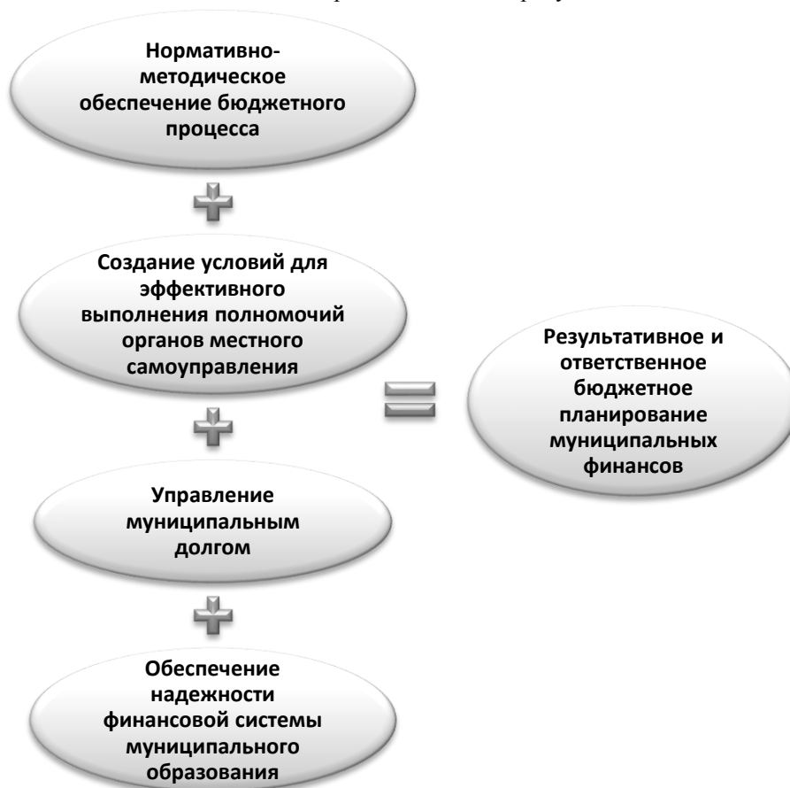
Рисунок 1 - Четыре составляющие бюджетного планирования муниципальных финансов

Результативность и ответственность бюджетного планирования муниципальных финансов по нашему мнению должны включать 4 составляющих представленных на рисунке 1.