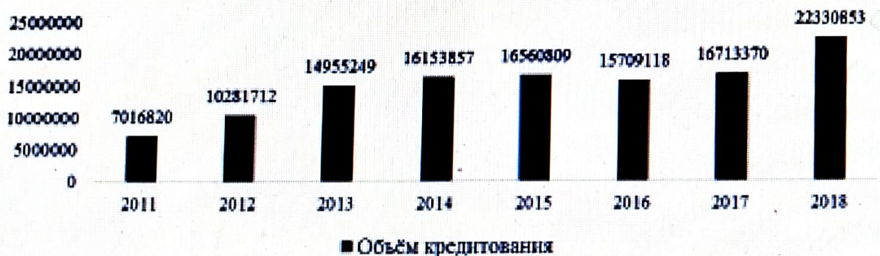
Рис. 3. Динамика объемов кредитования физических лиц в Приморском крае на 1 января 2010–2018 годов, млрд руб

Объемы кредитования физических лиц в России представлены на рис. 3.