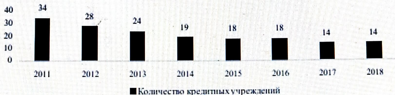
Рис. 1. Динамика количества кредитных учреждений в Приморском крае на 1 января 2011–2018 годов, в единицах

Динамика количества кредитных учреждений на территории Приморского края отражена на рис. 1.