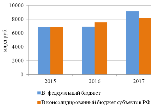
Рисунок 1 – Динамика поступлений администрируемых ФНС России доходов в консолидированный бюджет РФ в 2015–2017 гг. (составлено по данным ФНС России)

Изложение основного материала исследования с полным обоснованием полученных научных результатов. Любые изменения налогового законодательства отражаются на наполняемости бюджета страны – федерального или консолидированного бюджета субъектов РФ. И, следовательно, только анализ поступлений платежей позволяет сделать вывод, были ли данные изменения своевременными или нет. На рисунке 1 представлена динамика поступлений администрируемых ФНС России доходов в консолидированный бюджет РФ в 2015–2017 гг. [5].