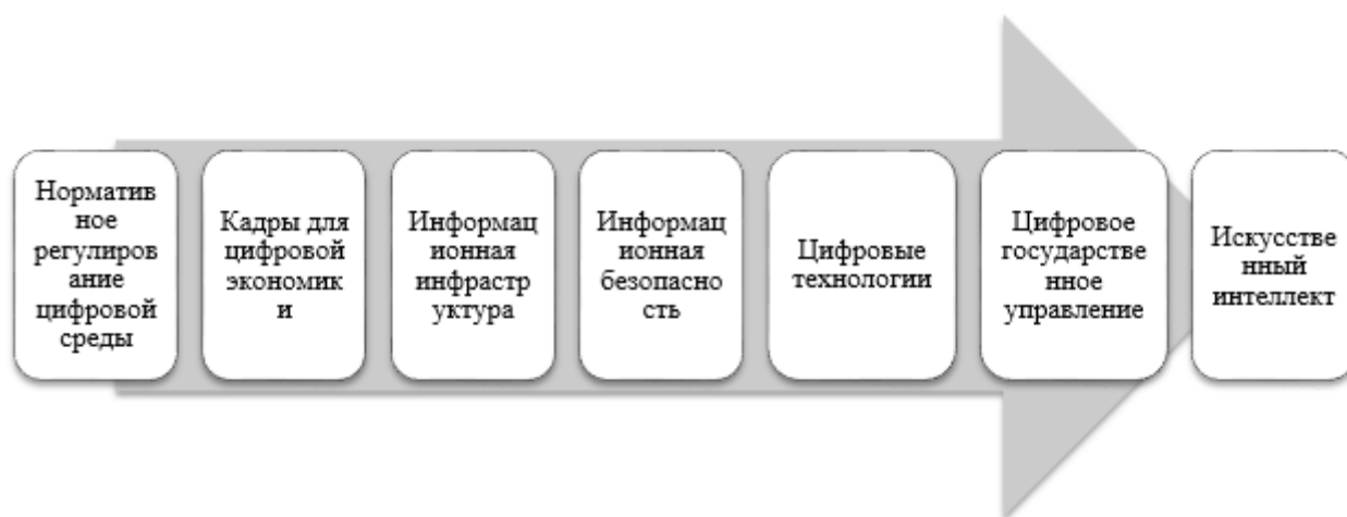
Рисунок 3. Структура национального проекта «Цифровая экономика Российской Федерации»

Основополагающим документом развития цифровизации в Российской Федерации является национальный проект «Цифровая экономика Российской Федерации» [7]. В состав Национального проекта «Цифровая экономика Российской Федерации» входят следующие федеральные проекты (Рисунок 3).