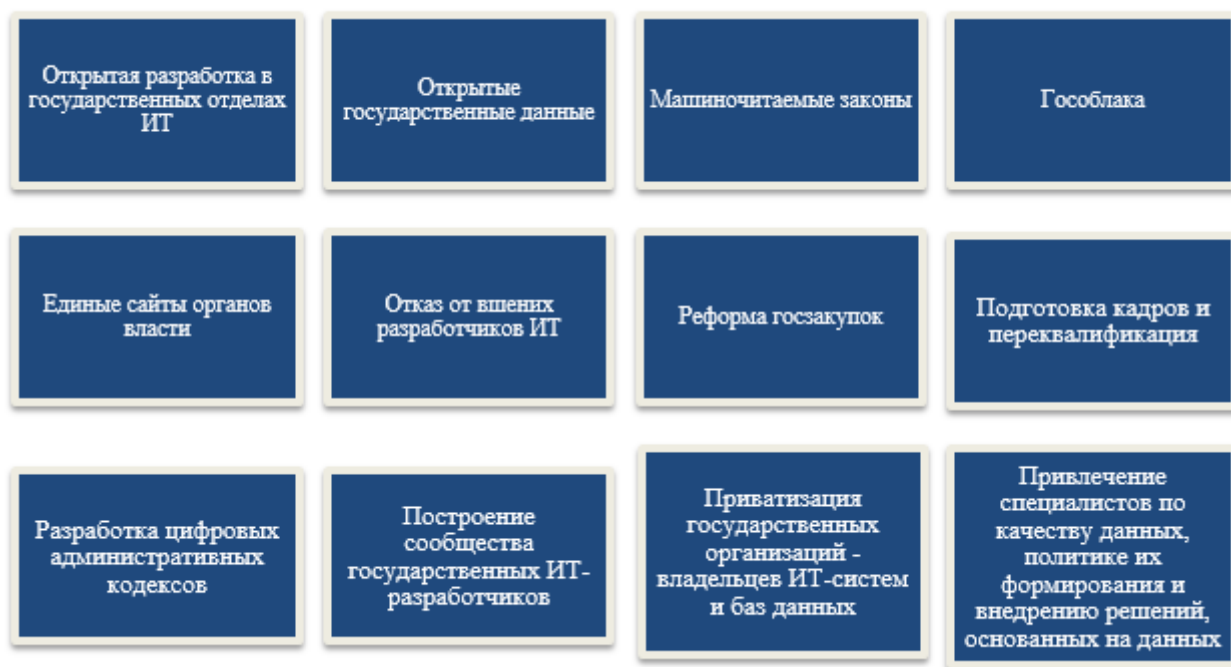
Рисунок 2 – Элементы цифровой трансформации в государственном управлении

С развитием общества и повышения уровня информатизации и компьютеризации граждан, роль государства смещается из-за неподготовленности к изменениям будущего, само же государство прекрасно осознает значимость таких изменений и начинает процесс адаптации выражающемся в цифровизации государственных и муниципальных органов власти [5].