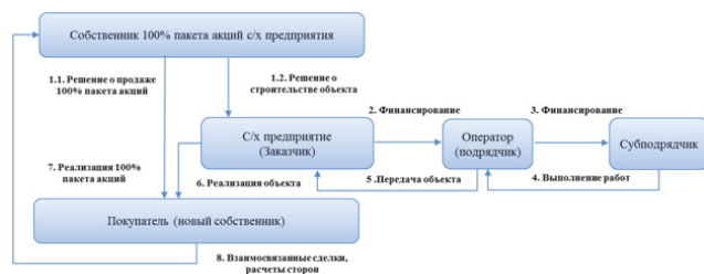
Рисунок 1 – Управленческие решения и цепь действий по реализации актива

Предыстория вопроса о строительстве объекта: в 2012 году заказчик (исследуемое предприятие) определило компанию - оператора строительства, который, в свою очередь, должен был отобрать подрядчика для возведения объекта. Проектная стоимость объекта составляла 128,7 млн. руб. Отношения между заказчиком и оператором были оформлены через договор подряда со сроком сдачи до конца 2015 года, и, после оформления, средства авансом были перечислены оператору (подрядчику). Предполагалось, что по итогам строительства объект будет передан заказчику для целей дальнейшей реализации в составе взаимосвязанных сделок.