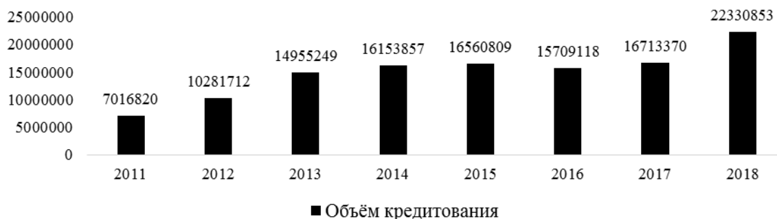
Рис. 3. Динамика объемов кредитования физических лиц в Приморском крае на 1 января 2010–2018 годов, млрд руб

Объемы кредитования физических лиц в России представлены на рис. 3.