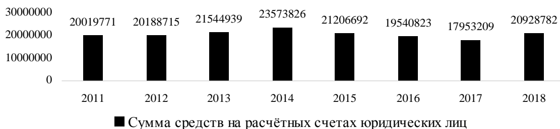
Рис. 4. Динамика открытия расчетных счетов в кредитных учреждениях Приморского края юридическими лицами, млрд руб.

Отдельно следует рассмотреть динамику открытия расчетных счетов юридических лиц, которая представлена на рис. 4.