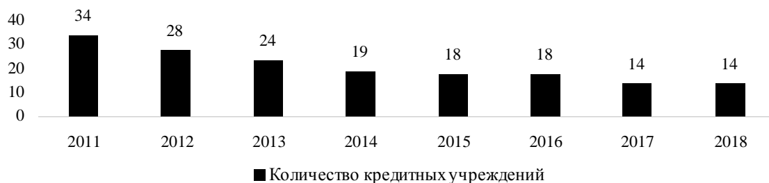
Рис. 1. Динамика количества кредитных учреждений в Приморском крае на 1 января 2011–2018 годов, в единицах

Динамика количества кредитных учреждений на территории Приморского края отражена на рис. 1.