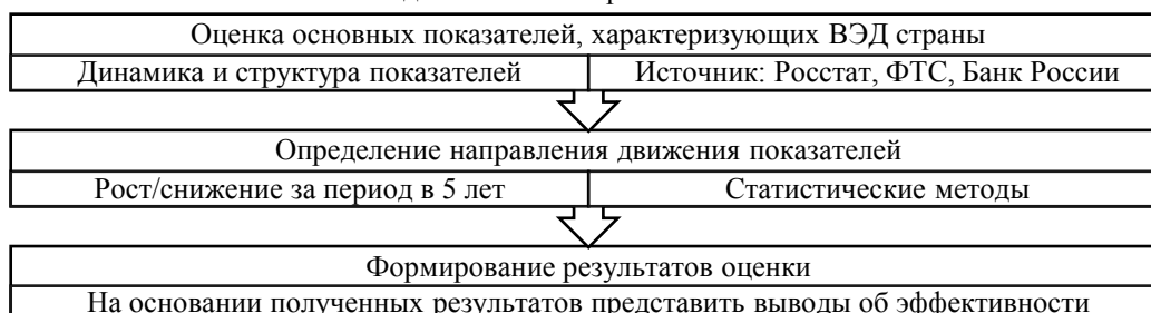
Рисунок 4 – Этапы осуществления оценки эффективности внешнеэкономической деятельности страны (составлено автором)

Проработка комплексного подхода предполагает в первую очередь определение последовательности проведения оценки эффективности. На рисунке 4 представлены основные этапы осуществления оценки эффективности внешнеэкономической деятельности страны.