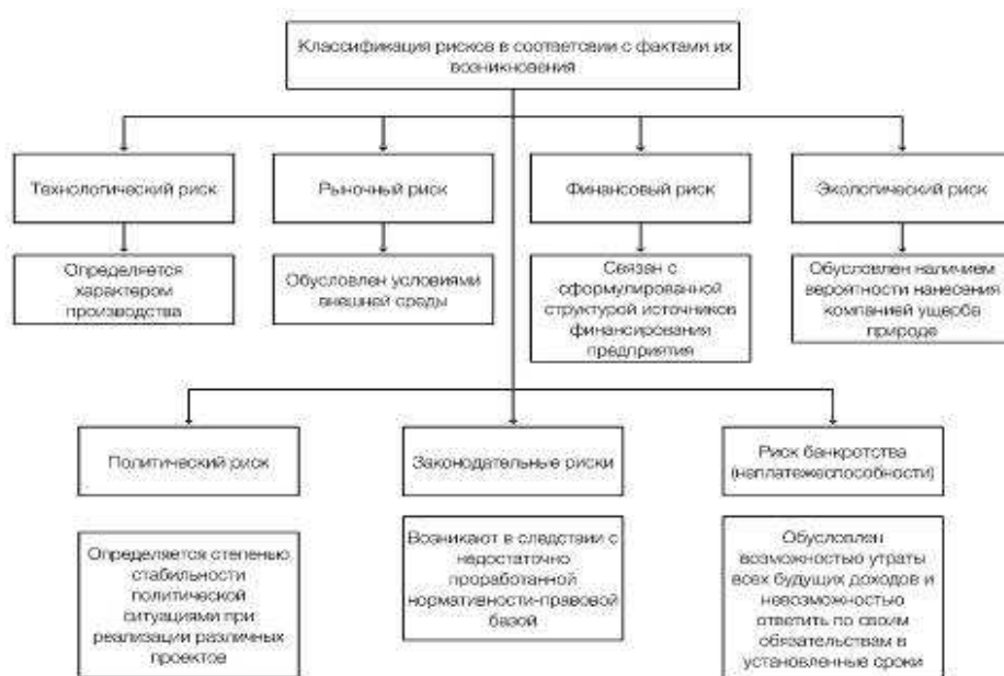
Рис. 2. Классификация рисков в соответствии с фактами их возникновения – процедуры внутреннего контроля – действия, направленные на минимизацию рисков, влияющих на достижение целей экономического субъекта