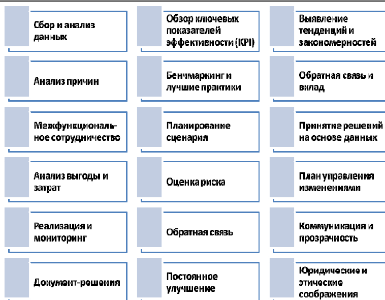
Рис. 2. Протоколы корректировки управленческих решений в адаптивном управлении человеческим капиталом в цифровой экосистеме организации

Следуя указанным шагам, организации смогут оценить эффективность адаптивного управления человеческим капиталом в соответствии со своей стратегией цифровой трансформации, определить возможности для улучшения и принять обоснованные решения по оптимизации своего человеческого капитала для достижения цифрового успеха.