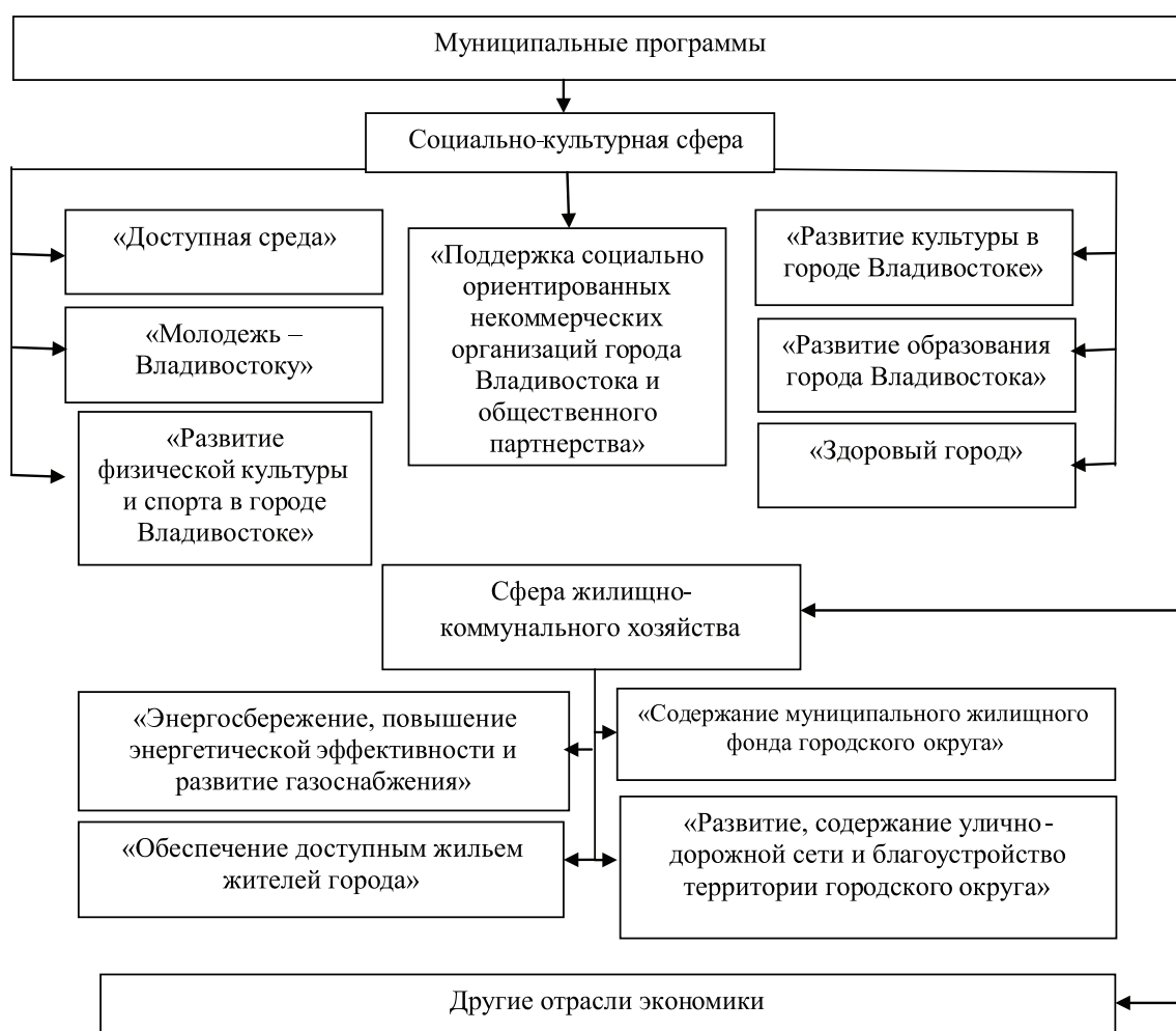
Рис. 1. Муниципальные программы Владивостокского городского округа

Население играет важную роль в развитии муниципальных образований. В этой связи администрация Владивостокского городского округа стала реализовывать на территории муниципального образования различные программы, которые способствуют улучшению качества жизни населения, что непосредственно влияет на социально-экономические показатели территориального образования.