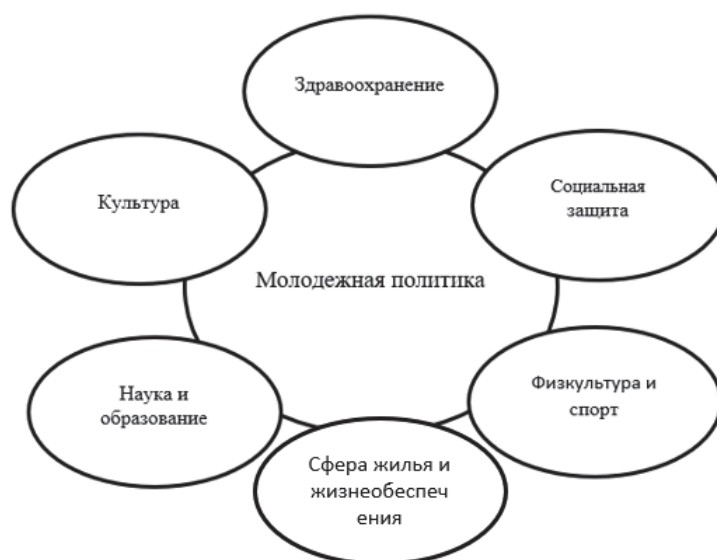
Рис. 2. Место молодежной политики в социальной и экономической сферах

На сегодняшний день существуют различные механизмы и технологии реализации государственной молодежной политики, которые включают в себя несколько блоков, показанных в табл. 1.